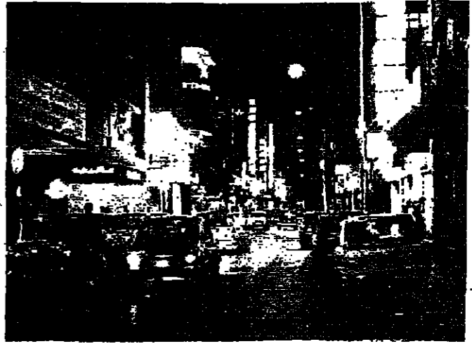
شارع الحمراء كما يبدو ليلا هذه الأيام